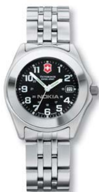
LARGE/GRANDE 26841.CB SMALL/PETITE 24842.CB