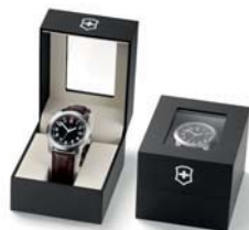
STANDARD PACKAGING EMBALLAGE STANDARD